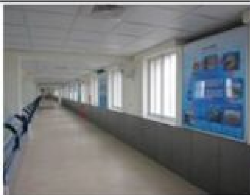
二樓參觀走道(全長 108 米)