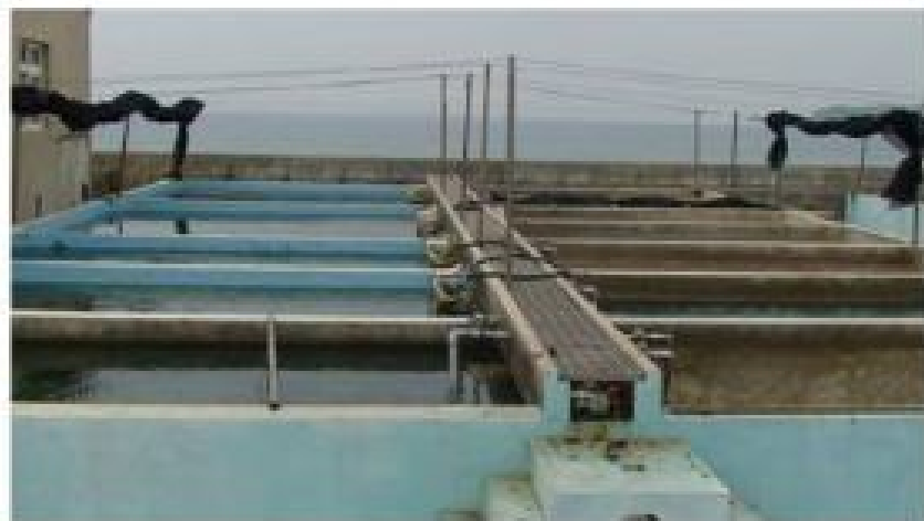
貝類池及餌料生物池26口